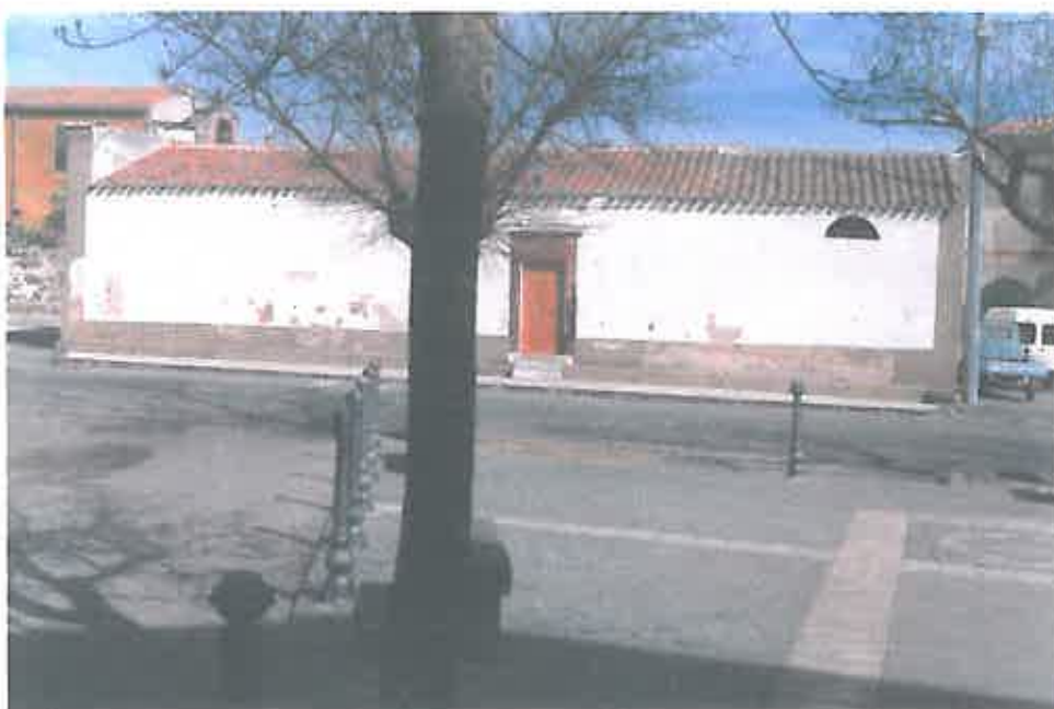
C) Chiesa di S. Antonio